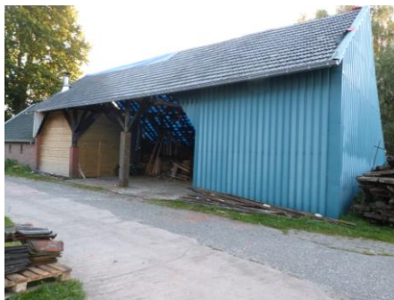
Kapschuur met het nieuwe dak

De kapschuur waar o.a. de houtkachel staat wordt op dit moment voorzien van nieuwe dakbedekking. Daarnaast zijn we nog bezig om aan de eisen van het Waterschap te voldoen wat betreft de riolering. Aangezien de buitengebieden niet op de riolering aangesloten zijn, betekent dit dat er een Iba nodig is. Op dit moment is die er wel een, maar die moet aan de uitgebreide situatie aangepast worden, zodat er voldoende capaciteit is. Dit is een grote investering. Hierin kunt u ons steunen door een gift over te maken.