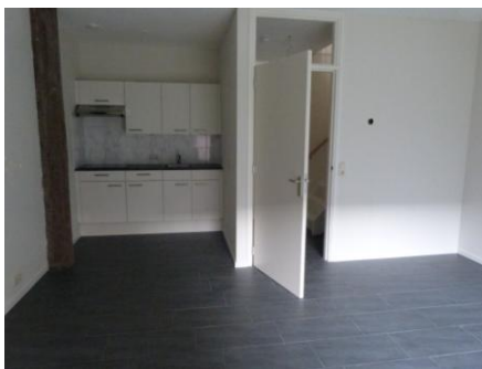
3 e appartement

De verbouwing gaat gestaag door. Het eerste appartement is zoals gezegd bewoond. Nu de hulpverlening daadwerkelijk is gestart, weet je ook waarom je de afgelopen jaren zo hard gewerkt hebt. Het tweede appartement is per 1 maart bewoond en het derde appartement krijgt, op het moment dat we dit schrijven, de laatste likjes verf.