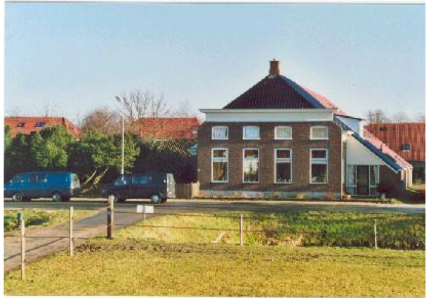
Stichting "Het Mosterdzaad"